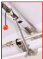
Universalbeschlag für Sektionaltore mit Normal- und Niedrig-sturz-Beschlag