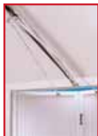
Sonderbeschlag für Drehflügel-tore (Achtung: wenn der automatische Torverschluss gewünscht wird, bestellen Sie bitte unsere Sonderschiene für Drehflügel-tore)