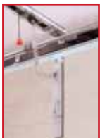
Einbau Konsole für Sektionaltore (Sonderbeschlag)