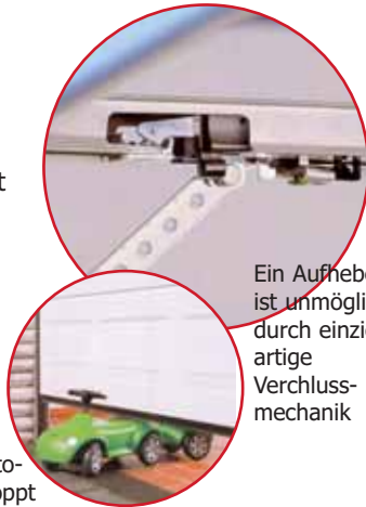
Ein Aufhebeln ist unmöglich durch einzigartige Verchlussmechanik

Beim Schliessen des Tores rastet die Aufschiebesicherung in den Anschlag der Führungsschiene. Das ist der wirksamste Schutz gegen Aufhebeln. Diese mechanische Aufschiebesicherung funktioniert immer. Auch ohne Strom!