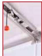
Universalbeschlag für Schwingtore

Die Hydrotool Garagentorantriebe sind serienmässig mit einem Universalbeschlag für alle Schwing- und Sektionaltore ausgestattet.